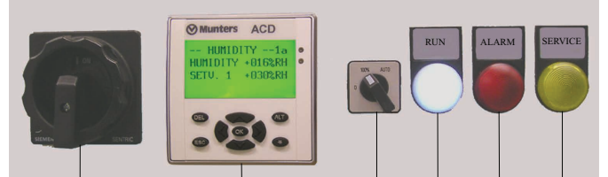
2005-2015 arasında ML17, ML23 ve ML30 nem alıcılarda bulunan ACD/ICD kontrolör eskimiştir.