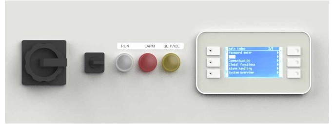
Kitte kullanılan yeni Climatix kontrolör, kullanımı kolay bir arayüze sahiptir ve ünite üzerinde orijinal CE işaretini tutar.