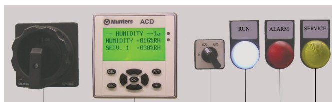
Sterownik ACD/ICD montowany w osuszaczach ML17, ML23 i MLT30 wyprodukowanych w latach 2005-2015 jest przestarzały.