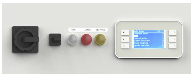
Nowy sterownik Climatix stosowany w zestawie ma łatwy w użyciu interfejs, przy jednoczesnym zachowaniu oryginalnego oznaczenia CE na urządzeniu.