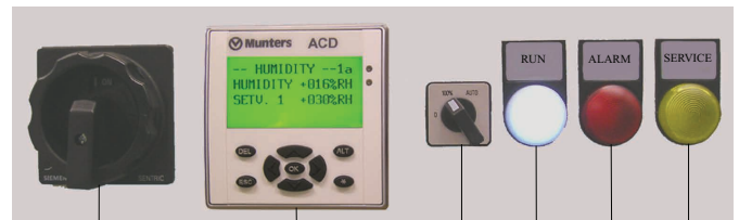
Die zwischen 2005 und 2015 verbaute ACD/ICD-Steuerung der Luftentfeuchter ML17, ML23 und ML30 ist veraltet und entspricht nicht mehr dem Stand der heutigen Technik.

* Dieser Umrüstsatz ist für die Geräte ML17, ML23 und ML30 zwischen 2005 und 2015 ausgelegt.