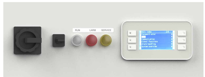
Die neue Climatix-Steuerung, welche als Umrüstsatz verwendet wird, verfügt über eine benutzerfreundliche Schnittstelle und behält gleichzeitig ihre ursprüngliche CE-Kennzeichnung.