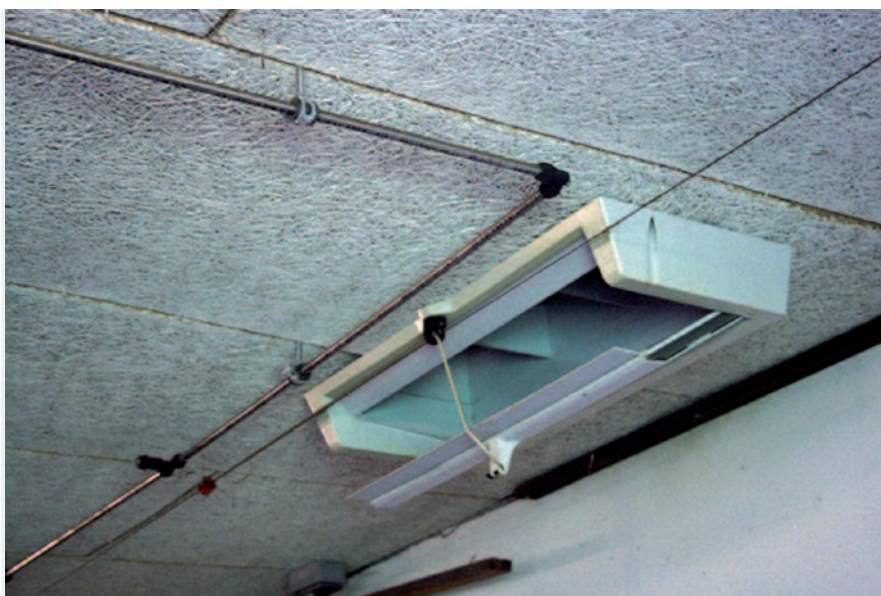
IL-luftindtag monteret i en svinestald.

IL-luftindtag er udviklet og produceres af Munters Turbovent A/S, Danmark.