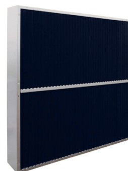
Nuovo LFd 50

Il filtro luce è fornito smontato in un pacco ottimizzando il volume di trasporto. L'LFd viene consegnato in una scatola di cartone robusto garantendo carico sicuro ed ottimizzazione dei costi di trasporto. Nello sviluppo del nuovo modello gli ingegneri di Munters si sono concentrati per fare un prodotto facile e veloce da assemblare. Il risultato è un prodotto che fornisce un risparmio del 30% nel tempo di assemblaggio rispetto al modello precedente.