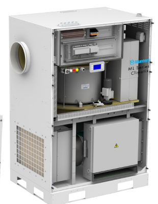
ML met Climatix Controls