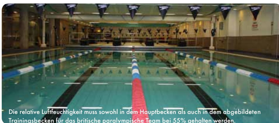
Die relative Luftfeuchtigkeit muss sowohl in dem Hauptbecken als auch in dem abgebildeten Trainingsbecken für das britische paralympische Team bei 55% gehalten werden.

Weitere Informationen über unsere Lösungen für die Schwimmbadenfeuchtung finden Sie auf www.munters.de/sport