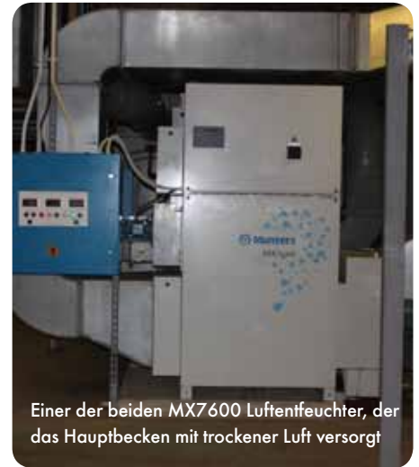
Einer der beiden MX7600 Luftentfeuchter, der das Hauptbecken mit trockener Luft versorgt