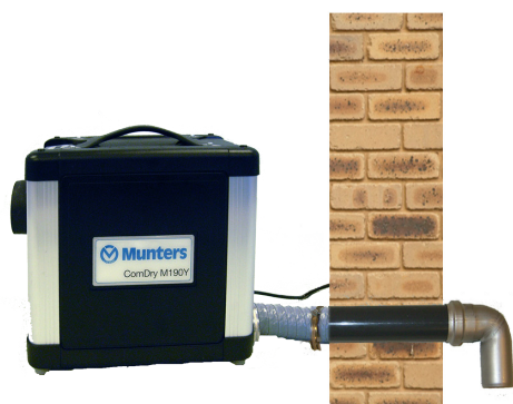
Eksempel på montering af væggennemføringskit