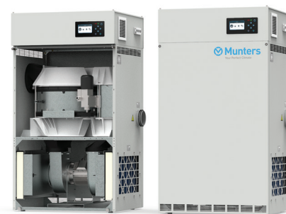
ML420 con AirC Munters

Questa tecnologia rappresenta 60 anni di innovazione e conoscenze applicative per un controllo perfetto del processo di deumidificazione.