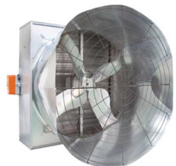
EC52 с двигателем Munters Drive

Устанавливая на конусный вентилятор Euroemme® EC52 высокоэффективный ЕС-двигатель, известный как Munters Drive, компания Munters достигла самого высокого уровня энергоэффективности и воздушного потока. Принцип работы электродвигателя Munters Drive основан на электронно-коммутируемой технологии (ЕС) и представляет собой последнее решение в области высокой эффективности электродвигателей, обеспечивая высокую производительность при низком потреблении энергии. Этот революционный двигатель не перегревается и работает тихо. Он обеспечивает снижение потребления электрической энергии до 60%. Двигатель не требует технического обслуживания, что помогает сэкономить деньги и добиться эффективности систем вентиляции в области сельского хозяйства. Конструкция вентилятора воплощает многолетний опыт специалистов компании Munters в области вентиляции, она имеет усиленный квадратный корпус, выполненный из стали с защитным покрытием Munters Protect, выпускной конус оптимизированной формы, обеспечивающей лёгкий монтаж и высокую производительность. Полностью металлический затвор, управляется редукторным двигателем, что делает открытие и закрытие лопастей независимым от потока воздуха или вращения винта. Конусный вентилятор EC52 с двигателем Munters Drive был разработан, испытан и реализован в лаборатории R & D компании Munters, а эксплуатационные свойства подтверждены представителями лаборатории BESS факультета сельскохозяйственной техники Университета штата Иллинойс, США).