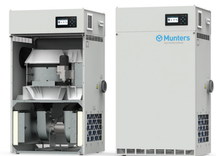
ML690 mit Munters AirC

Diese Technologie beruht auf 60 Jahren Innovation und Anwendungskennntnisse. Sie ermöglicht die optimale Regelung des Entfeuchtungsprozesses.