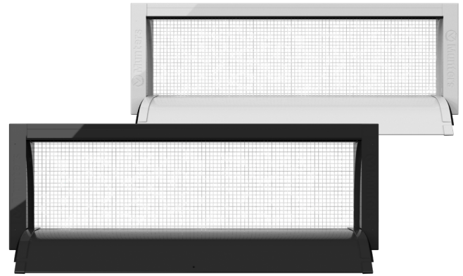
MWI vista frontal

Por razones de bioseguridad, está previsto un protector de metal galvanizado que impida accesos no deseados a la casa. Usando el MWI, cada agricultor obtendrá el clima ideal con un equilibrio adecuado entre rendimiento, eficiencia y presupuesto.