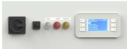
El nuevo controlador Climatix utilizado en el kit cuenta con una interfaz intuitiva y mantiene el marcado CE original en la unidad.

* Este kit de conversión está diseñado para las unidades ML17, ML23 y MLT30 fabricadas entre 2005 y 2015.