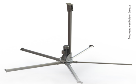
Nouveau ventilateur Breeze